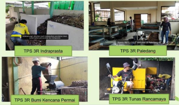
Foto Aktifitas Pengolahan Sampah di TPS 3R

Upaya yang dilakukan untuk meningkatkan capaian reduksi sampah tahun 2022 yaitu dengan pembangunan 2 (dua) lokasi TPS 3R pada Kelurahan Bojongkerta dan kelurahan Mekarwangi dimana setiap TPS 3R dapat melayani 200KK. TPS